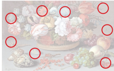
Auflösung aus Heft Nr. 18

Der Amerikaner John Singer Sargent (1856 bis 1925) galt als der bedeutendste Porträtmaler seiner Zeit. Das bedeutet aber nicht, dass er nur Menschen auf die Leinwand bannte, wie das Gemälde «White Ships» (Original oben) von 1908 zeigt.