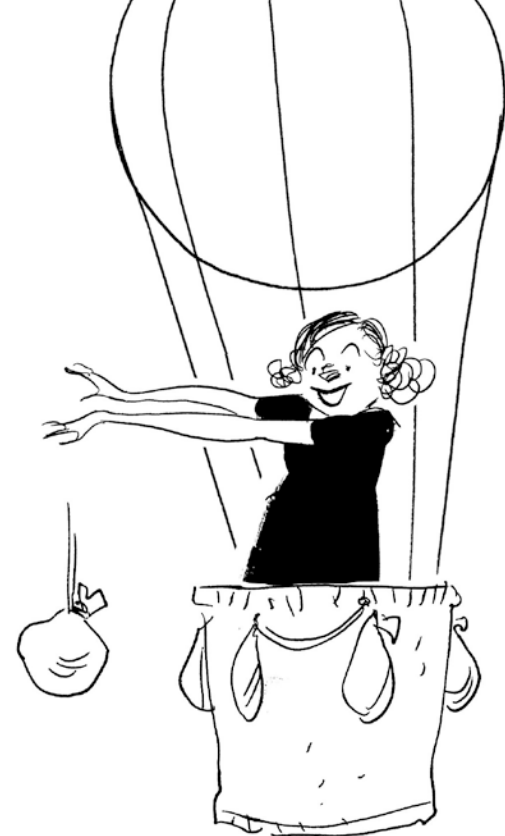
ILLUSTRATION: BEOBACHTER EDITION

... zum gewichtigen Thema Abnehmen. Wie gesunde Ernährung, Bewegung und Spass nachhaltig zum Wunschgewicht führen können, ohne Diäten und schädliche Jo-Jo-Effekte.