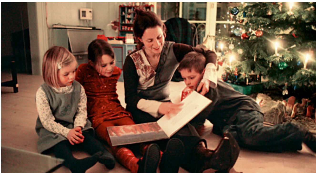
Unter dem Weihnachtsbaum liest man sich gerne die Weihnachtsgeschichte vor.

den Waldtieren all die feinen Sachen bringt. Doch eben: Siebenschläfer halten Winterschlaf.