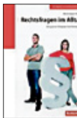
Rechtsfragen des Alltags.

Der grosse Schweizer Rechtsratgeber. Dominique Strelbel. ISBN: 978-3-85569-559-1. 31 Franken