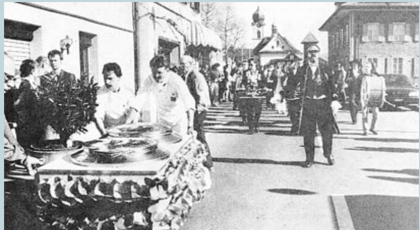
Auf der «Löwen-Terrasse» herrschten 1990 sommerliche Temperaturen. Hygienisch verpackt und unter den Klängen der Rotseehusaren «rückte» das Risotto an. Mehr als 1000 Personen genossen das pikante Risotto und die würzigen und flüssigen Zutaten.