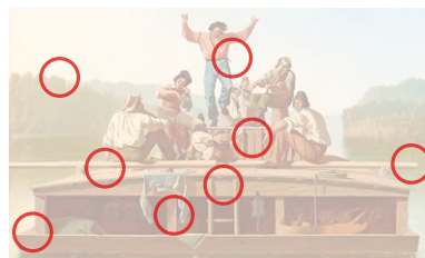
Auflösung aus Heft Nr. 16

Das Werk von Ljubow Popowa (1889 bis 1924) gilt als Höhepunkt der russischen Avantgarde. Dabei wurde die Künstlerin gerade mal 35 Jahre alt. Sie malte nicht nur auf Leinwand, sondern auch auf Porzellan und Stoffen.