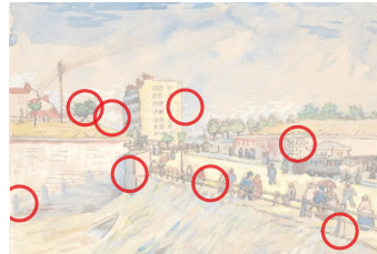
Auflösung aus Heft Nr. 15

Das Ölbild «Davos mit Kirche» malte der deutsche Expressionist Ernst Ludwig Kirchner (1880 bis 1938) im Jahr 1925 während seiner Davoser Zeit. 1937 stempelten die Nationalsozialisten seine Werke als entartet. Ein Jahr später beging Kirchner Suizid.