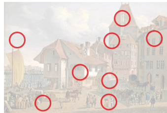
Auflösung aus Heft Nr. 13

Louis Vivin (1861 bis 1936) war ein Vertreter der naiven Malerei. Er arbeitete bis 1922 als Postbeamter, bevor er vom deutschen Kunstkritiker Wilhelm Uhde entdeckt wurde. «La Place des Halles et l'église Saint-Eustache, Paris» (Original oben) entstand 1935.