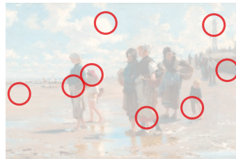
Auflösung aus Heft Nr. 4

Der belgische Expressionist Gustave de Smet (1877 bis 1943) erlitt 1932 einen Schlag des Schicksals: Seine Stammgalerie meldete ihren Bankrott. Mehr als 100 seiner Gemälde wurden für einen Spottpreis versteigert. Hier «De mosseleeters» (1923, Original oben).