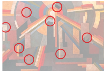
Auflösung aus Heft Nr. 1

Die ungarisch-indische Avantgardistin Amrita Sher-Gil (1913 bis 1941) reüssierte bereits mit 19 in Paris – als Pionierin der modernen indischen Kunst. «Winter» (Original oben) schuf sie zwei Jahre vor ihrem frühen Tod. Sie starb wegen einer missglückten Abtreibung.