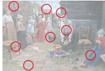
Auflösung aus Heft Nr. 22