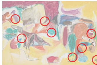
Auflösung aus Heft Nr. 14

(1887 bis 1918) war einer der ersten modernen Maler Portugals. Beeinflusst von Kubismus und Futurismus, schuf er Werke wie die Gouache «Clown, Pferd, Salamander» (1911/12, Original oben). Mit 31 Jahren starb er an der Spanischen Grippe.