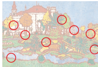
Auflösung aus Heft Nr. 10

Der Brite Edward Wadsworth (1889 bis 1949) war Ingenieur und Künstler. Er stützte sich auf Kubismus und Futurismus. Im Ersten Weltkrieg entwarf er im Dienst der königlichen Marine Tarnmuster für Schiffe. Der Holzschnitt «Yorkshire» (Original oben) entstand 1921.