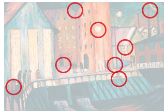
Auflösung aus Heft Nr. 21

Finden Sie die 8 Unterschiede. Edouard Manet (1832 bis 1883) sollte Jurist oder Marineoffizier werden. Mit 16 Jahren konnte er seine Eltern überzeugen, dass die Malerei besser sei für ihn. «Bar in den Folies-Bergère» (1882, Original oben) war sein letztes grosses Werk.