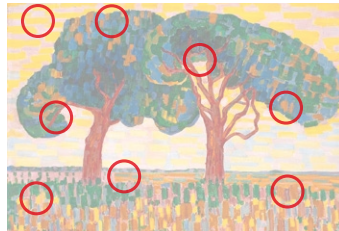
Auflösung aus Heft Nr. 8

Die Werke der englischen Kinderbuchillustratorin und -autorin Beatrix Potter (1866 bis 1943) finden bis heute grossen Anklang. Jährlich werden noch immer rund zwei Millionen ihrer Bücher verkauft, darunter die Geschichten von «Peter Rabbit» (Original oben).