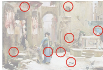
Auflösung aus Heft Nr. 6

«Iwan im Fauteuil» (Original oben) stammt von Sigrid Hjertén (1885 bis 1948). Die schwedische Expressionistin war Mitglied der Avantgardegruppen «Die Jungen» und «Die Acht». Hjertén gehörte zu den Lieblingsschülerinnen von Henri Matisse.