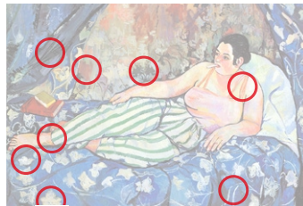
Auflösung aus Heft Nr. 1

«Daylight at Russell's Corners» (1944, Original oben) von George Ault (1891 bis 1948) zeigt einen Weiler bei Woodstock, New York. Mehrere Werke Aults beschäftigen sich mit dieser Häuseransammlung zu unterschiedlichen Tages- und Jahreszeiten.