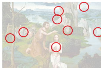
Auflösung aus Heft Nr. 21

Für «Dolce far niente» (Original oben) liess sich der britische Neo-klassizist John William Godward (1861 bis 1922) von antiken Motiven inspirieren. Godward beging Suizid. In seinem Abschiedsbrief schrieb er: «Die Welt ist nicht gross genug für mich und Picasso.»