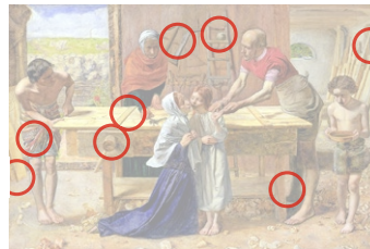
Auflösung aus Heft Nr. 26/2018

Finden Sie die 8 Unterschiede. Die französische Malerin Suzanne Valadon (1865 bis 1938) hat sich künstlerisch und privat über alle Konventionen hinweggesetzt. Wegweisend waren ihre realistischen Darstellungen von Frauen, wie hier auf dem Gemälde «La Chambre bleue» von 1923.