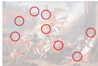
Auflösung aus Heft Nr. 18

Für die Serie «Die Kartenspieler» des französischen Malers Paul Cézanne (1839 bis 1906) standen Bauern und Tagelöhner Modell. Fünf Gemälde entstanden in diesem Zyklus. Eines davon wurde vor drei Jahren für mehr als 250 Millionen Dollar verkauft.