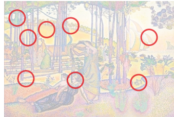
Auflösung aus Heft Nr. 17

Nach dem Studium zog die amerikanische Malerin Mary Cassatt (1844 bis 1926) nach Frankreich, wo sie sich den Impressionisten anschloss. Ihr künstlerisches Hauptthema war der Alltag von Frauen. «Children Playing with a Cat» (Original oben) entstand 1908.